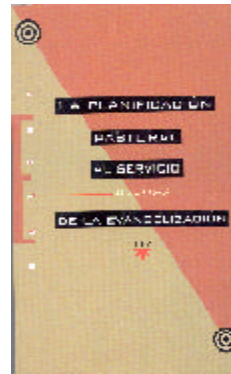
La Planificación Pastoral al Servicio de la Evangelización

Consultar también ECUCIM (Evangelización de las Culturas en la Ciudad de México) pp. 669-687.