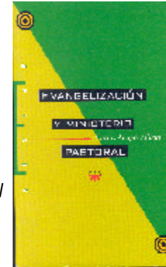
Evangelización y Ministerio Pastoral